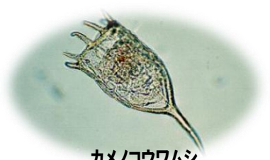
カメノコウワムシ