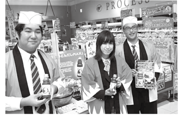
開発したうどんだしをセルバで販売する様子

先輩は「吉田のうどんの情報を全国に発信して、讃岐うどんを越えるくらい有名にするぞ。」と口癖のように言うけど、さすがにそれは無茶な目標だと思っていた。しかし、言葉というものは口にしていると不思議な力を帯びてくる。ひばりが丘高校うどん部は、3年前に「吉田のうどん観光大使」に任命され、いろんなメディアから逆に取材を申し込まれるようになっていった。