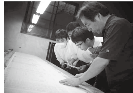
地場産業の職人の技術に触れる高校生

3億円かけて、生徒が顔をあげて、車窓に目を向けながら通学するようになってもらいたいというのは贅沢な話に聞こえるかもしれませんが、それが地域の未来に賭ける一番遠い近道だと私は信じています。