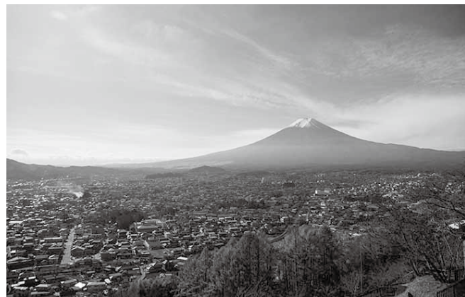
日本一の富士山の麓を、日本一の起業家育成の都市へ

何かに挑戦する際にはリスクが伴う。よって、挑戦を促すためには、リスクを少しでも軽減し、挑戦をサポートすることが必要だ。環境を整えることで、挑戦者のマインドは一気に高まる。しかし、なぜ北麓地域がビジネスの分野での挑戦を促すべきなのか。それは、ビジネスにおける挑戦者、すなわち起業家が増えれば、地域はその恩恵を受け、潤い、活性化につながるからだ。詳述すれば、起業家が増えることで新しい雇用が生まれ、新しい商品やサービスが増加し、地域住民の生活の質も向上する。地元企業にとっても新商品・新サービスを活用したビジネスが展開でき、相乗効果が望める。さらに自治体も法人税などの税収が増えることで、新しい行政サービスを展開できる。その結果、地域は一層暮らしやすくなり、その影響でまた新たな起業家が育つという循環が生まれ、地域は活性化するのである。