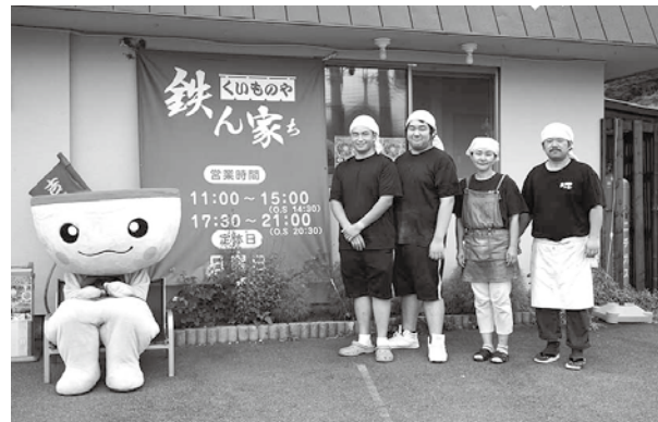
うどん店にて実施した対決イベントの告知写真 (SNS用)

うどん部の活動自体は地道な活動がほとんどで、市内に約60店あるうどん屋にカメラを片手に取材に行く。休日は、お客さんにアンケート用紙を配らせてもらい、市場調査を実施する。その後、アンケートの集計。データの分析。うどん屋を支援するイベントの企画。新メニューの考案、試作。