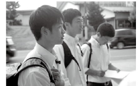
取材中の高校生の真剣な眼差し