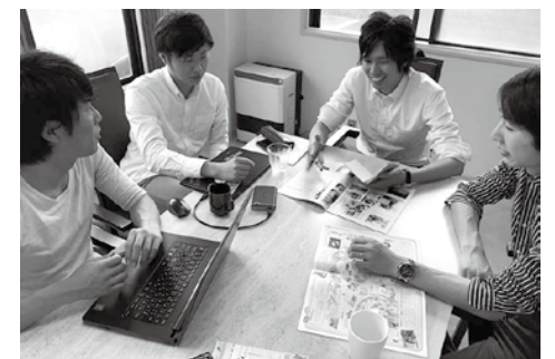
起業したメンバーたちとの打ち合わせ

将来にわたり地域を豊かにするために何より大事なものは、地域が「人材」に投資し、地域を良くする「人材」を育てることだ。なぜなら、地域を想い未来を切り拓くのは、いつだって人間なのだから。