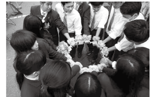
多様な生徒が織りなし、伝える地域の未来の輪